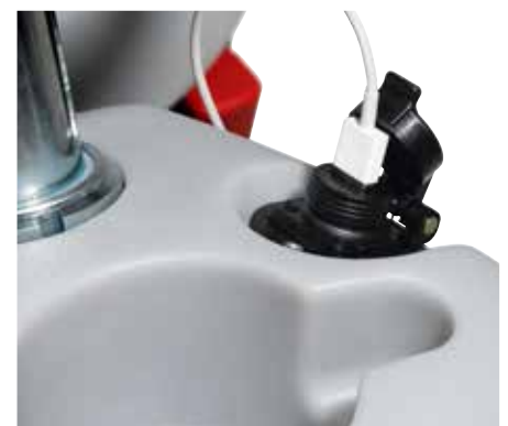
Puerto USB opcional