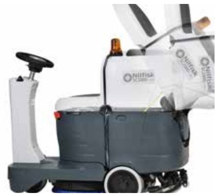
Depósito de recuperación totalmente inclinable que facilita el acceso al compartimento de la batería y al sistema Ecoflex.