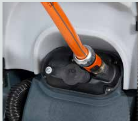
Sistema de llenado con cierre automático cuando el depósito está lleno (opcional)