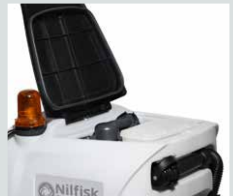
Fácil de limpiar con tapa del depósito de recuperación completamente extraíble.