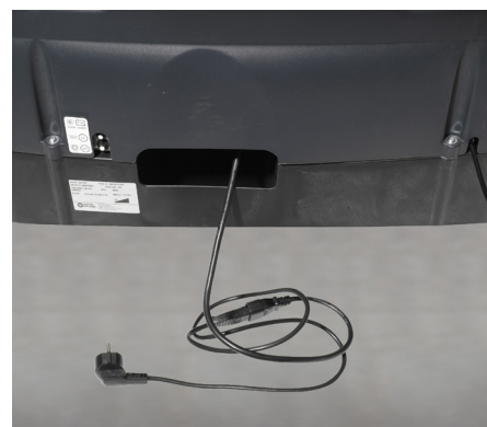
El cargador de batería incorporado asegura un funcionamiento continuo y sin complicaciones.